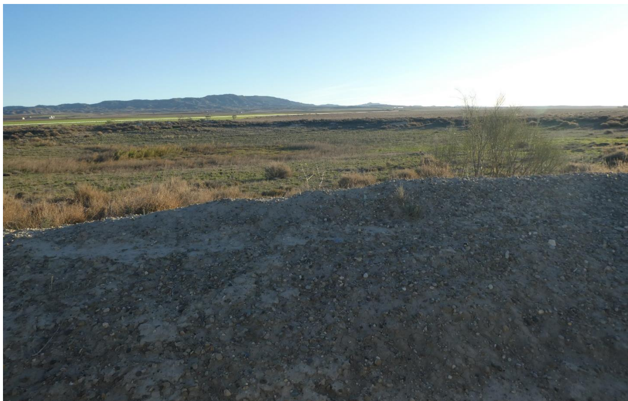
Balsa de Candasnós