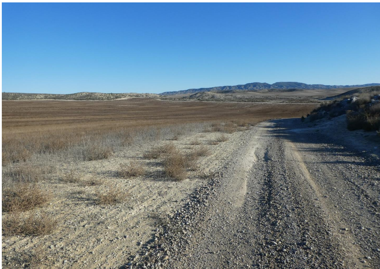
Emplazamiento del subcampo A (zona oeste)