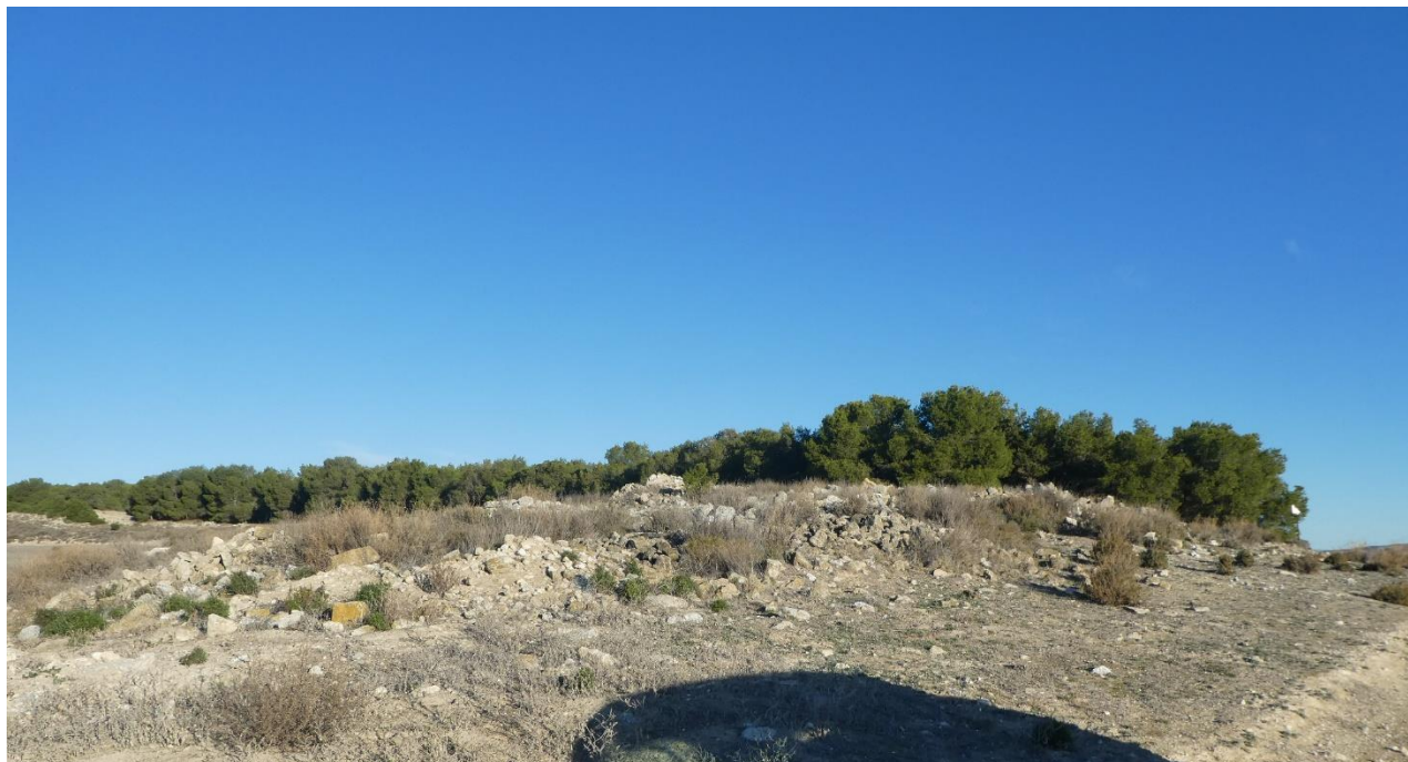
Pinar de repoblación próximo a la SET