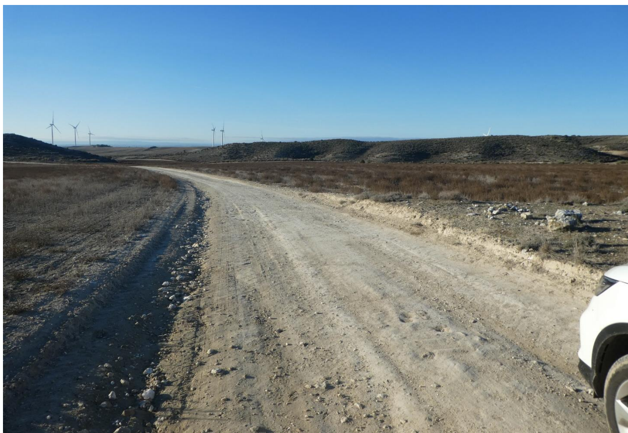
Emplazamiento de la Zona de Acopio (a la derecha del camino) y del subcampo B (a la izquierda)