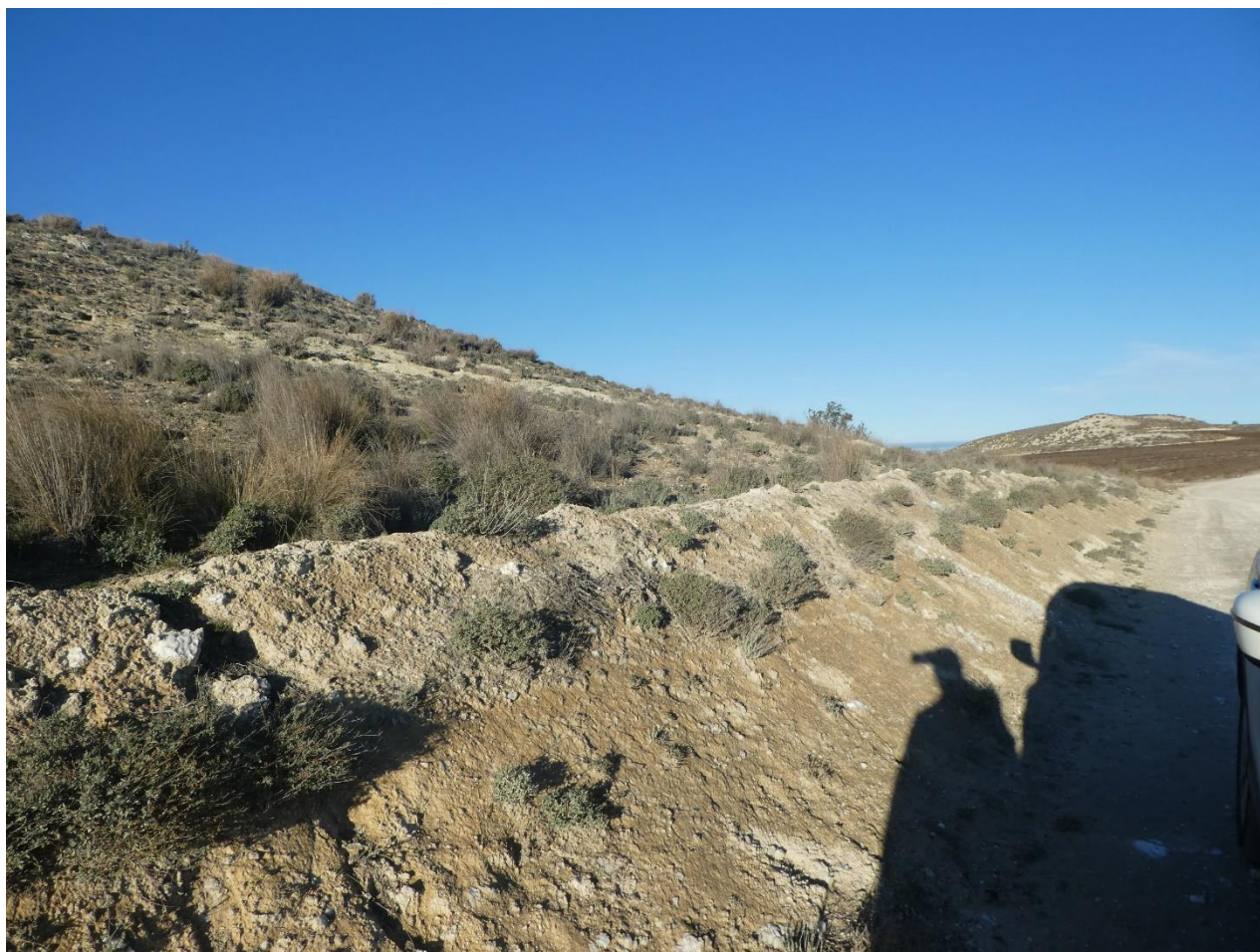
Matorral en cunetas y bordes de camino