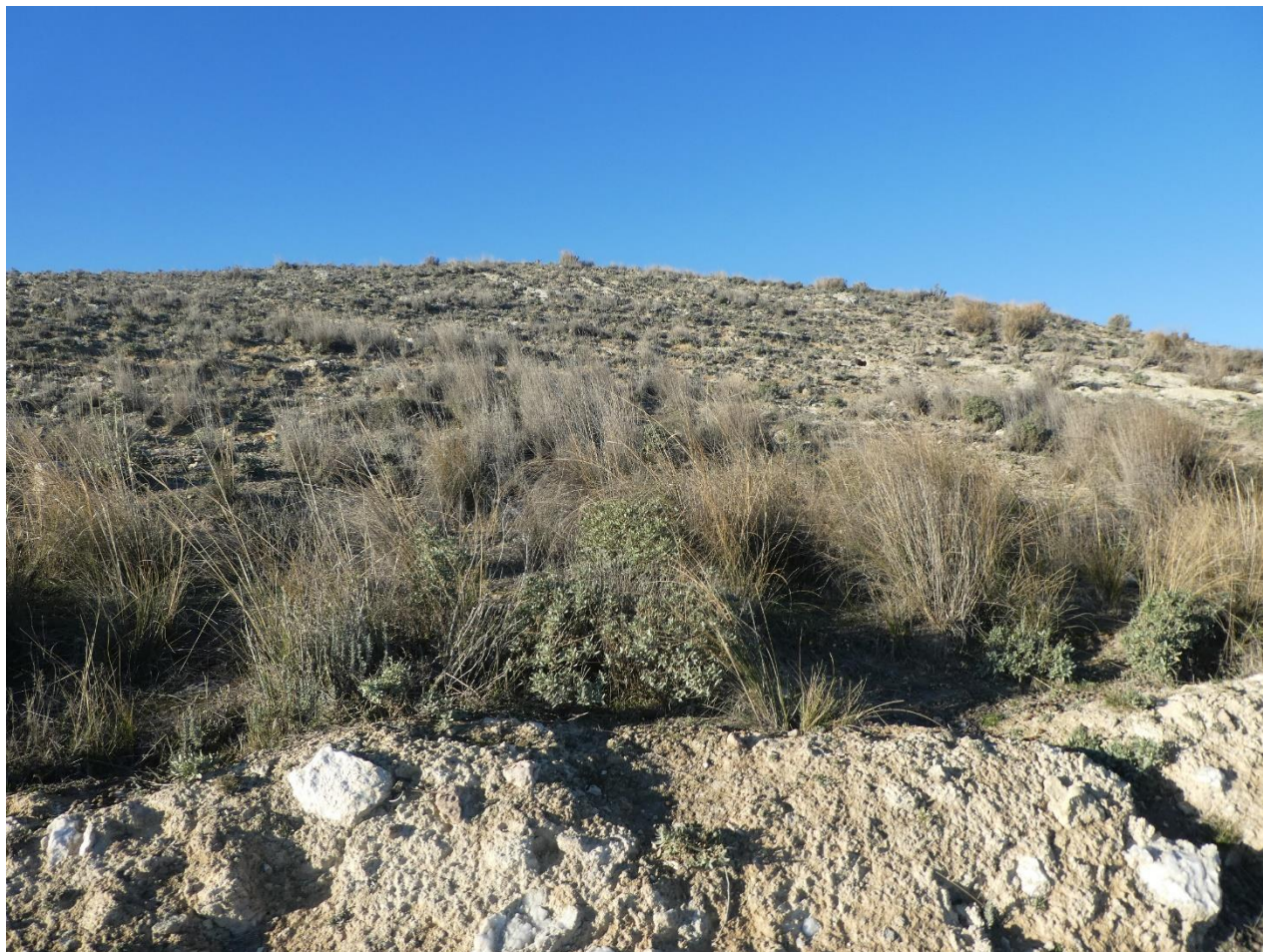
Matorral en cunetas y bordes de camino