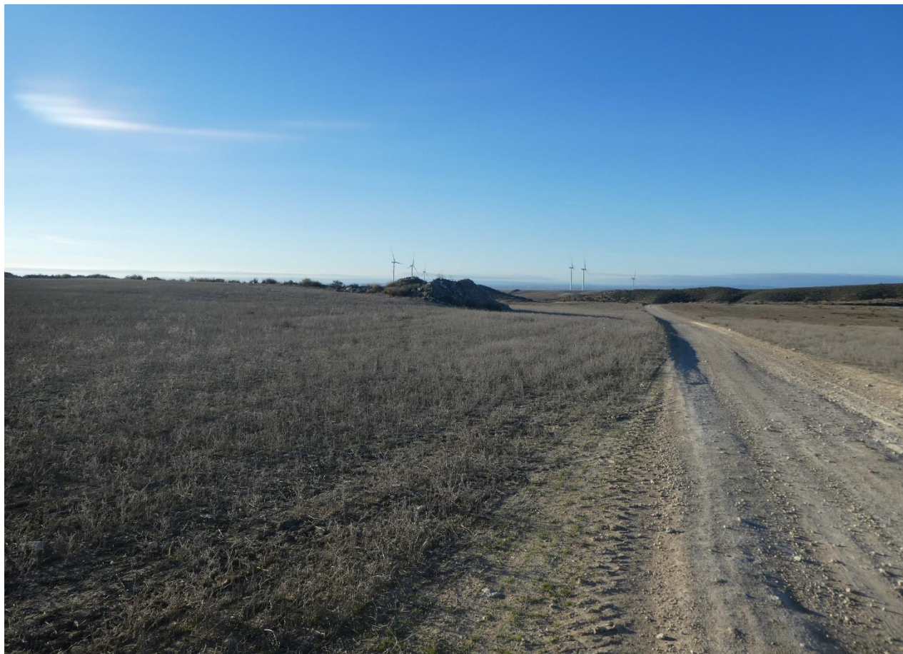
Zona de emplazamiento de la SET "ALFAJARÍN" 33/220 kV (objeto de otro proyecto)