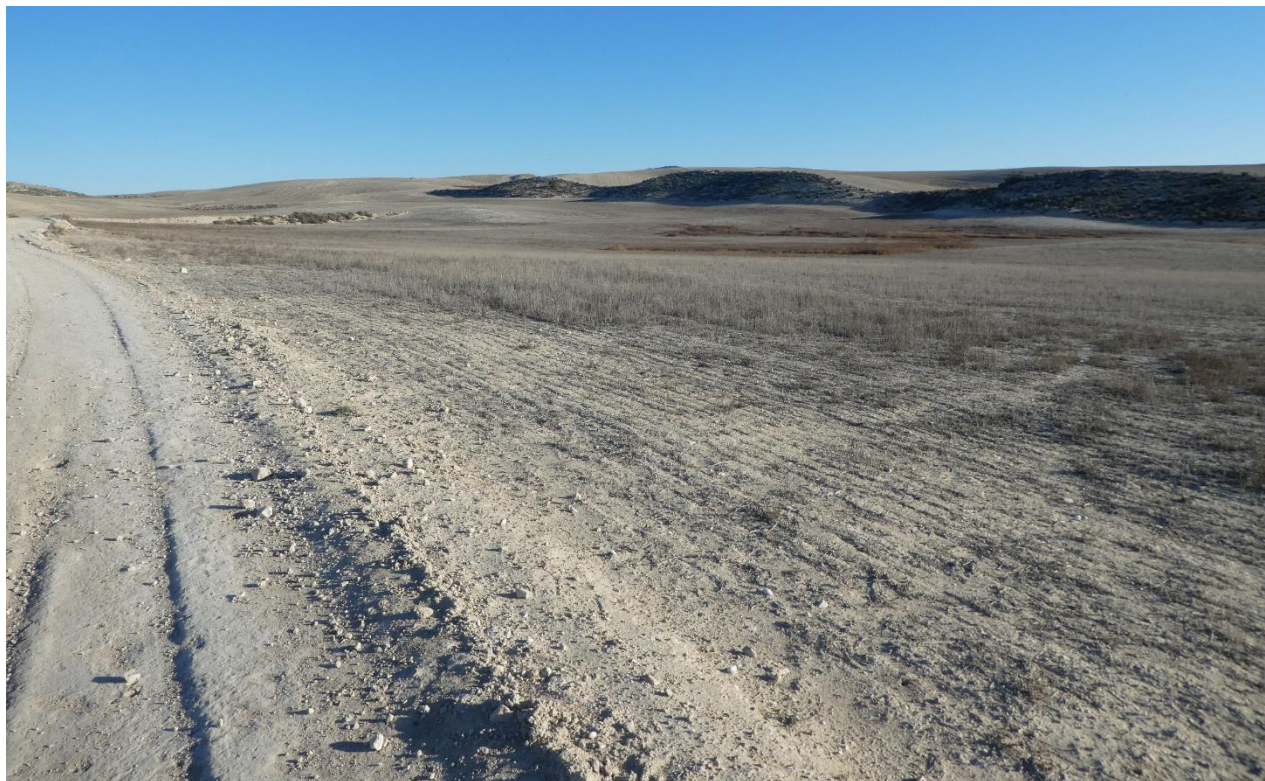
Emplazamiento del subcampo C