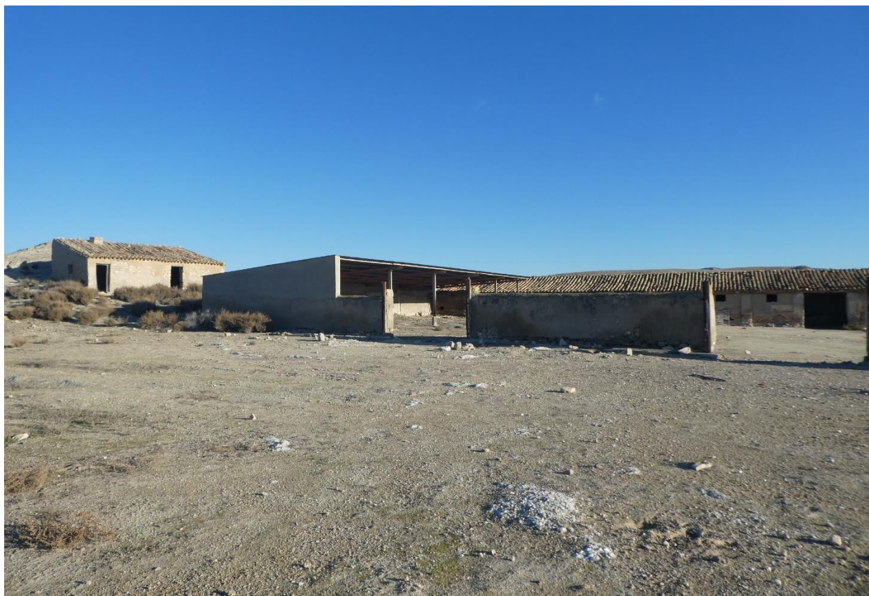
Edificación junto al subcampo C