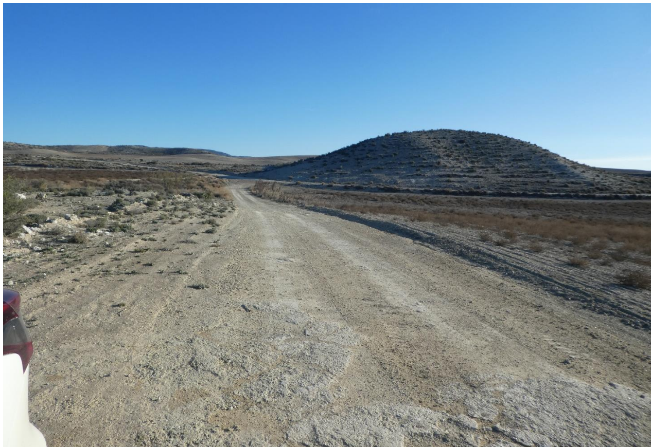
Emplazamiento del subcampo A (zona norte)