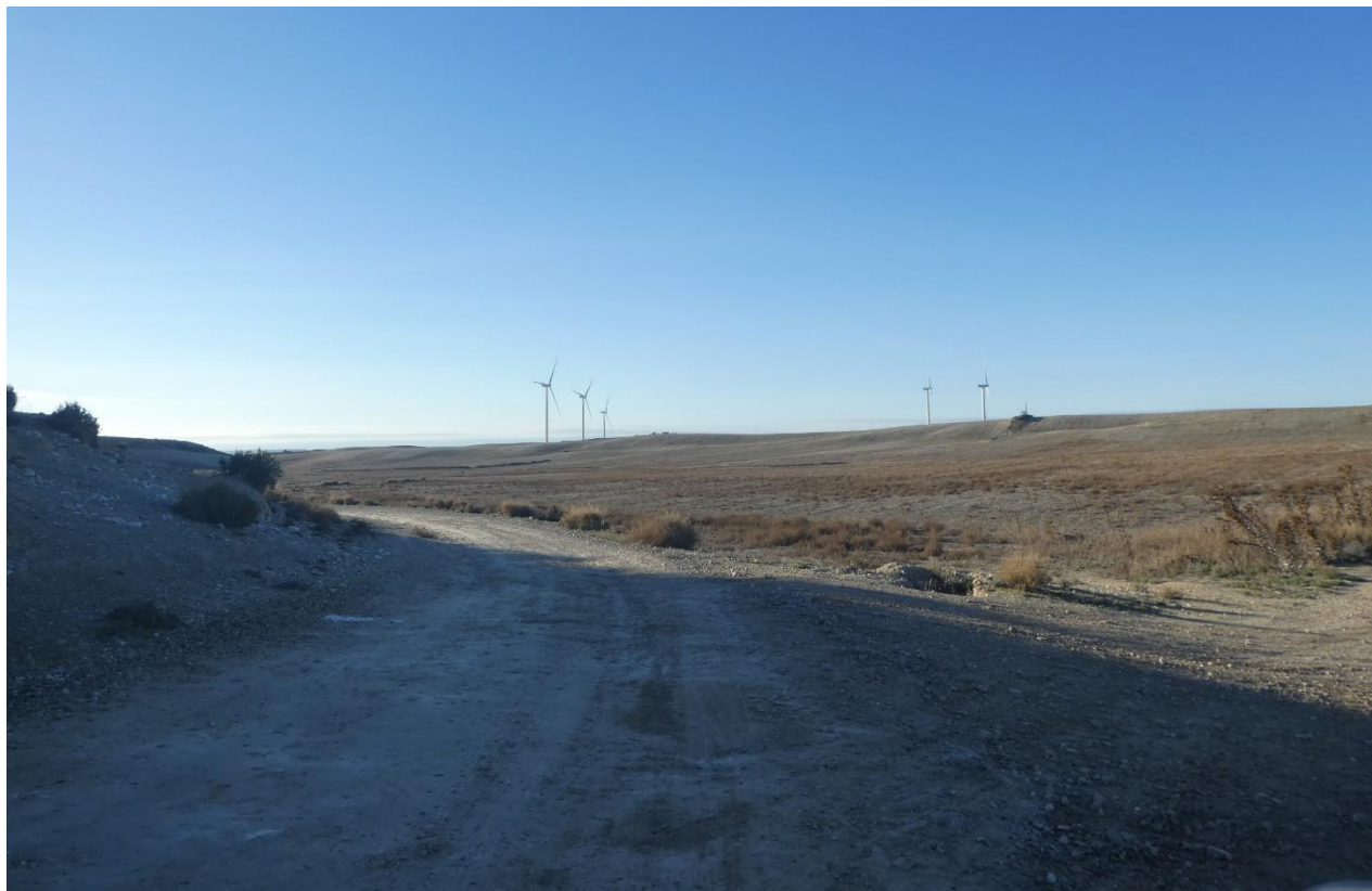
Emplazamiento del subcampo A (zona sur)