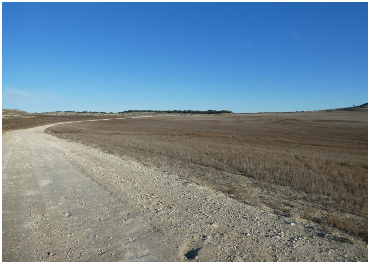
Emplazamiento de subcampo B (a la derecha del camino) y de la Zona de Acopio (a la izquierda)